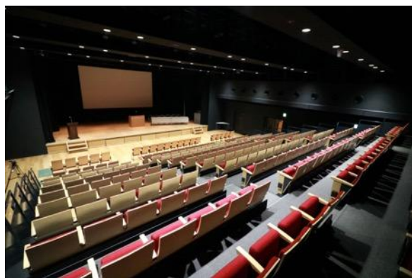
福岡市科学館 サイエンスホール (300席)

ドーム直径：25m (水平) 設備：既存設備の他にIPS用として 10000ルーメン4Kプロジェクター 6台以上仮設予定 (プレゼンに使用可能) 機材の持ち込み等に関しては別途相談要