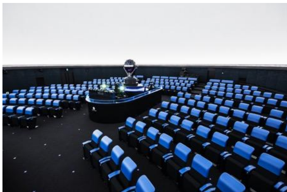
福岡市科学館 ドームシアター (220席)

ドーム直径：25m (水平) 設備：既存設備の他にIPS用として 10000ルーメン4Kプロジェクター 6台以上仮設予定 (プレゼンに使用可能) 機材の持ち込み等に関しては別途相談要