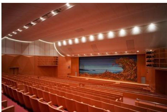
福岡国際会議場 メインホール (1,000席)