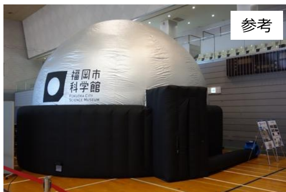
福岡国際センター仮設ドーム (20-40席)